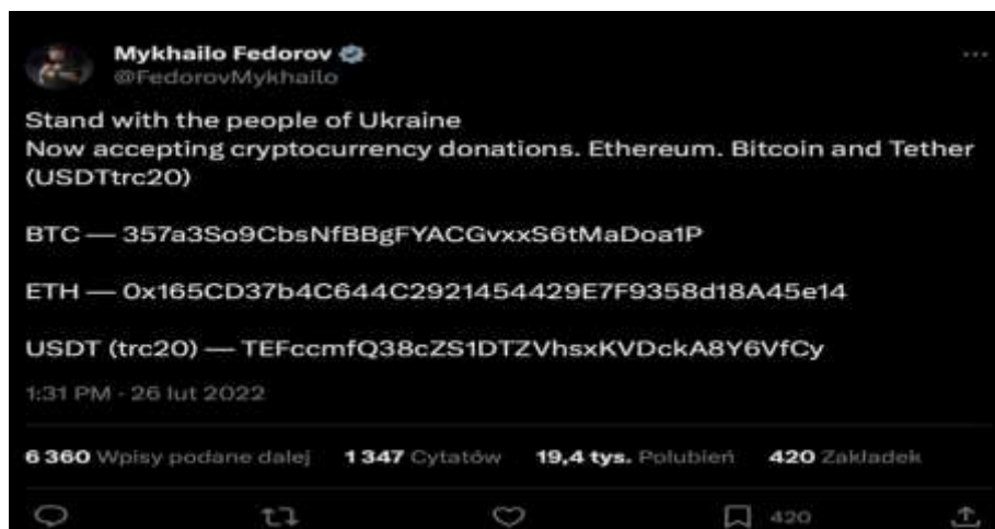
Zrzut ekranu 1. Wpis Mykhailo Fedorova w serwisie Twitter.