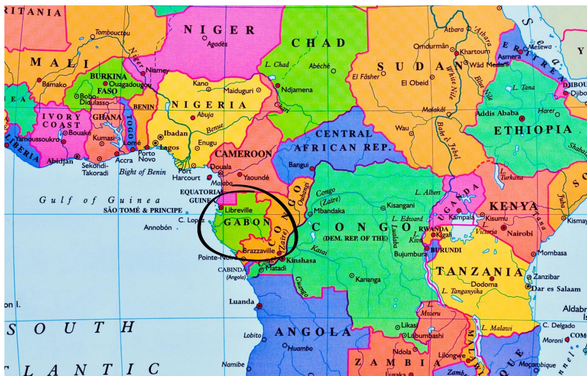
Mapa 1. Gabon na mapie Afryki.

Gabon to państwo położone w środkowej Afryce nad brzegiem Oceanu Atlantyckiego. Graniczy z Gwineą Równikową na zachodzie, Kamerunem na północy i Kongiem na wschodzie. Stolicą tego kraju, a zarazem największym miastem, jest Libreville 1 . Historia jego niepodległości jest ściśle związana z rodziną Bongo. W sierpniu 1960 roku Gabon uzyskał niepodległość od Francji. W 1967 roku Omar Bongo, przyszły prezydent, założył Gabońską Partię Demokratyczną (fr. Parti Démocratique Gabonais, PDG), skupiając całą władzę w jednym punkcie. Mimo wprowadzenia w latach 90. XX wieku systemu wielopartyjnego PDG nadal sprawowała realną władzę 2 . Omar rządził państwem aż do swojej śmierci w 2009 roku. Następcą Omara był jego syn – Ali Bongo. Objął on urząd prezydenta krótko po śmierci ojca, zwyciężając w wyborach prezydenckich 3 .