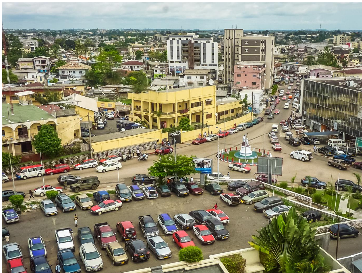
Zdjęcie 1. Libreville – stolica Gabonu.

Na nagraniu dostrzec można siedzącego na fotelu prezydenta z wyraźnie zauważalnym grymasem na twarzy. Bongo początkowo stwierdził, że czuje się zdezorientowany – nie wie, co się dzieje ani gdzie są jego bliscy 17 . Następnie zaapelował o pomoc do swoich zwolenników, zachęcając ich do „podniesienia głosu” 18 .