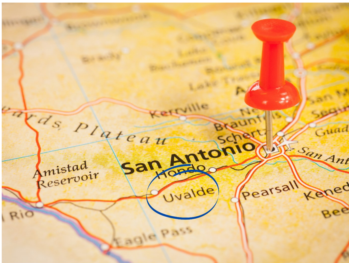
Mapa 1. Umiejscowienie Uvalde na mapie Teksasu.

atakiem nie chodził na zajęcia – może to świadczyć prawdopodobnie o jego przygotowaniach do zamachu.