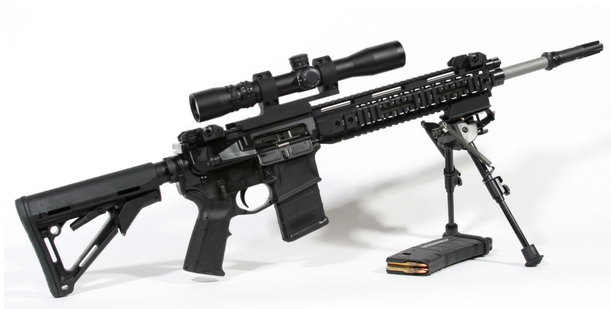
Zdjęcie 1. Karabinek AR-15, który w zależności od potrzeb można wyposażać w dodatkowe elementy oraz urządzenia optyczne.

Osiemnastolatek około godziny 11.30 wszedł na teren szkolny i po upływie kilku minut zaczął oddawać pierwsze strzały. Przemierzył dwa krótkie korytarze znajdujące się przy wejściu do szkoły, po czym wszedł do klasy złączonej wewnątrz z inną. Chwilę później otworzył ogień do wszystkich tam obecnych, krzyząc: „Czas umierać!”[6]. Dzięki przeprowadzonej analizie audio, pozyskanej wskutek działań policji, stwierdzono, że w ciągu pierwszych trzech minut po wejściu do sal 111 i 112 napastnik oddał 100 strzałów — od 11.33 do 11.36[7]. W trakcie zdarzenia używał karabinu szturmowego typu AR-15 oraz pistoletu ręcznego.