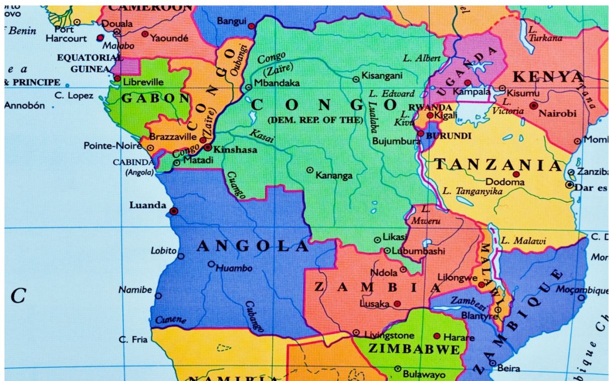
Mapa 1. Umiejscowienie Angoli w zachodniej części kontynentu afrykańskiego.

Na początek przyjrzyjmy się położeniu geograficznemu, strukturze politycznej oraz gospodarce państwa, aby zrozumieć, z jakimi wyzwaniami musi mierzyć się społeczeństwo i rząd. Republika Angoli położona jest w południowo-zachodniej Afryce nad Oceanem Atlantyckim. W 1975 r. uzyskała niepodległość od Portugalii i pogrążyła się w wojnie domowej, która trwała do 2002 r. Przez ten czas Angola była zwolennikiem poglądów lewicowych i socjalistycznych, które pod 38-letnimi rządami prezydenta Jose Eduarda dos Santosa ewaluowały w system demokratyczny i gospodarkę rynkową.