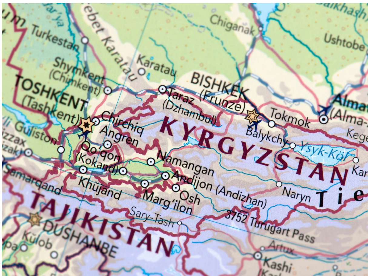
Mapa 1. Kirgistan na mapie Azji Środkowej.

28 kwietnia 2021 r. wybuchł spór graniczny między Kirgistanem a Tadżykistanem. Konfrontacja rozpoczęła się wraz z próbą instalacji przez Tadżyków kamer w zakładzie wodociągowym w celu monitorowania dystrybucji wody. Strona kirgiska próbowała zlikwidować filary, na którym zostały one zamontowane, co doprowadziło do konfliktu zbrojnego. Zginęło łącznie ponad 50 obywateli Tadżykistanu i Kirgistanu, ponad 200 zostało rannych, a ok. 40 tys. cywilów zostało przesiedlonych. W obu krajach zniszczono domy, szkoły, liczne sklepy i przejścia graniczne[1]. Władze Kirgistanu oskarżyły Tadżykistan o niesprawiedliwą dystrybucję wody. Wiosną i latem, czyli w trudnym dla rolnictwa okresie, zużycie wody wzrasta aż dziesięciokrotnie, co nierzadko prowadzi do napięcia stosunków pomiędzy sąsiadami. Sytuację dodatkowo pogorszyła budowa większej liczby przygranicznych elektrowni wodnych, utrudniając jednocześnie regulację zaopatrzenia krajów w wodę[2].