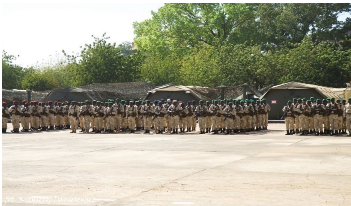
Zdjęcie nr 1. Zakończenie szkolenia batalionu malijskiego w Koulikoro Training Centre.

Pomimo pozornego spokoju przez wiele lat w Burkina Faso atmosfera wewnętrzna była napięta ze względu na brak skutecznego systemu sprawiedliwości, problemy ekonomiczne czy słabą opozycję. Najlepszą jednostką wojskową Burkina Faso był RSP, którego główne zadanie stanowiło zbudowanie i utrzymanie kordonu wokół prezydenta. Regiment liczył od 600 do 800 żołnierzy, dobieranych nie według pochodzenia etnicznego czy zamieszkania, a lojalności wobec prezydenta. W zamian cieszyli się szeregiem przywilejów i lepszym traktowaniem. Otrzymywali lepsze mieszkania, pensję i poza służbą nie obowiązywał ich ten sam system zachowań, co innych żołnierzy. Dodatkowo dysponowali lepszym uzbrojeniem, dzięki czemu dominowali nad innymi jednostkami sił zbrojnych. Przez wiele lat było to rozwiązanie modelowe dla innych państw, m.in. Mali. Pozostałe jednostki były bardzo mocno podzielone na specjalizacje. Wojsko znajdowało się cały czas pod kontrolą, kadra była słabo wyszkolona, a jednostki – niezbyt liczne. Chodziło o to, aby zminimalizować ryzyko przewrotu wojskowego i pokonać RSP[11].