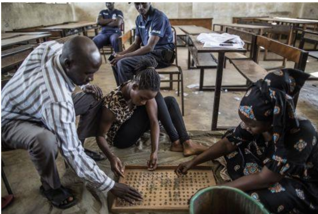
Fot. 2 Zliczanie głosów

Prezydent Gambii jest wybierany w jednej turze w wyborach powszechnych na pięcioletnią kadencję. Zarejestrowani wyborcy otrzymują kartę, którą muszą okazać w wyznaczonym lokalu. Po sprawdzeniu uprawnień urzędnik zaznacza lewy palec wskazujący wyborcy niezmywalnym tuszem 10 . Zamiast papierowych kart do głosowania w Gambii używa się specjalnych kamyczków. Każdy wyborca otrzymuje kamyk i umieszcza go w tubie na zapieczętowanym bębnie, który odpowiada faworyzowanemu przez niego kandydatowi.