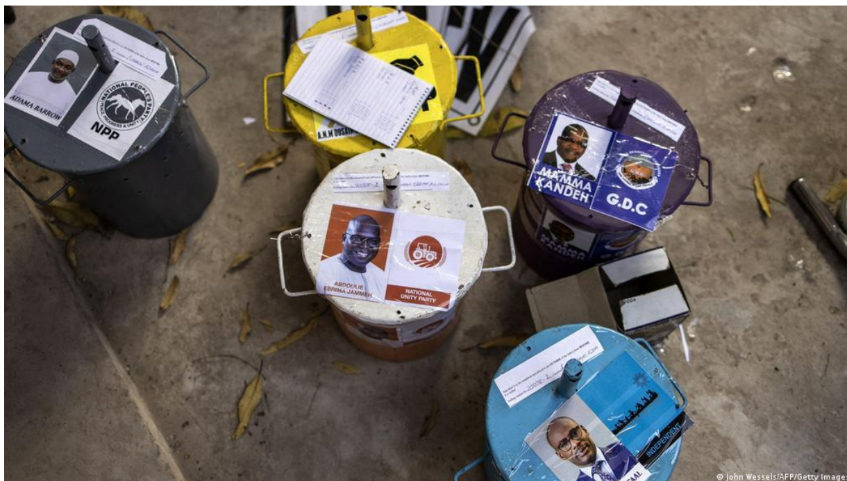
Fot. 3 Bębny z poszczególnymi kandydatami, https://www.dw.com/en/gambia-election-polls-close-in-first-vote-since-dictatorship/a-60018563 , 20.12.2021

do odpowiedniego bębenka. Bębny umieszczane są w kabinie, aby zachować tajemnicę głosowania. Włożenie kamyczka powoduje uruchomienie dzwonka wewnątrz kabiny, aby zaszykalizować, że głos został oddany 11 . Jako środek ostrożności przeciwko COVID-19 na potrzeby tych wyborów przy wejściach i wyjściach z kabiny umieszczono środki odkażające 12 .