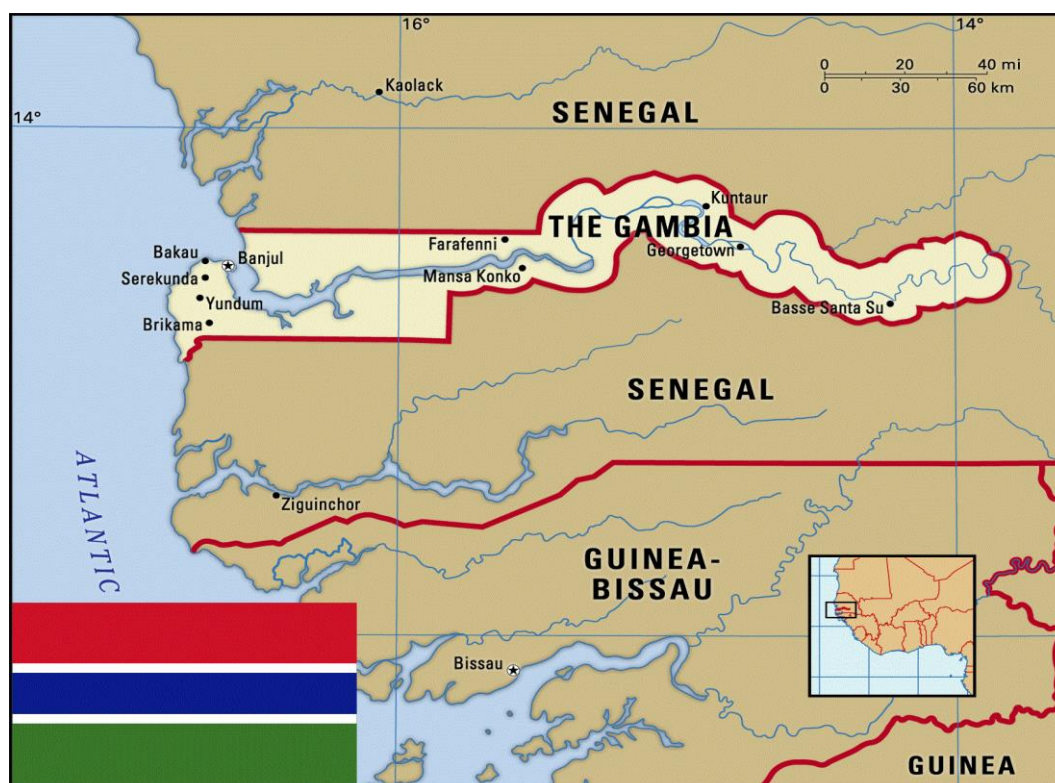
Fot. 1 Mapa Gambii z flagą u dołu, https://www.britannica.com/place/The-Gambia , 20.12.2021

4 grudnia 2021 roku odbyły się wybory w Gambii. Zwycięstwo odniósł dotychczasowy prezydent Adama Barrow, reprezentant Narodowej Partii Ludowej (National People's Party, NPP). Zdobył on 53,23 procent głosów, pokonując przy tym pięciu innych kandydatów 1 . Jego główny rywal – Ousainou Darboe – w wyniku głosowania uzyskał 27,7 procent. Wydarzenie to można nazwać przełomowym, gdyż jest ono pierwszym oficjalnym „eventem” wyborczym Gambii od 2016 roku, kiedy to obalono panującego przez prawie 23 lata dyktatora Yahyi Jammeha 2 . Tegoroczne wybory określono nawet mianem „sprawdzianu dla demokracji w Gambii”.