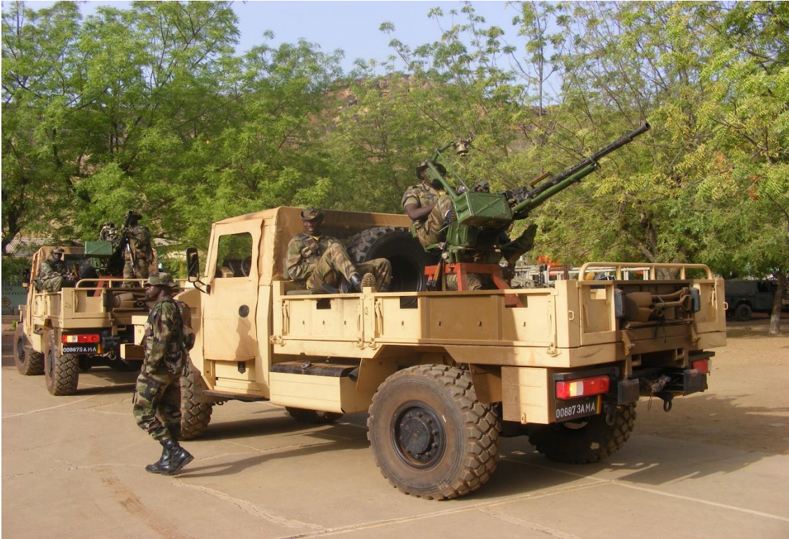
Zdjęcie 1. Wyposażenie armii malijskiej.

Kilka dni wcześniej, 23 stycznia, w okolicy miejscowości Dioungani, region Mopti, śmierć poniosło co najmniej sześciu żołnierzy malijskich, a wielu innych odniosło rany. Do ataku na siły malijskie doszło niedaleko granicy z Burkina Faso 5 .